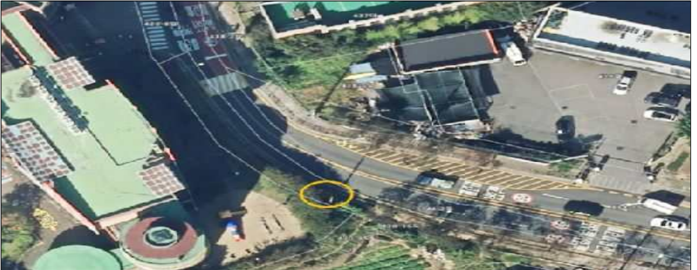
보정동 430-16번지 일대