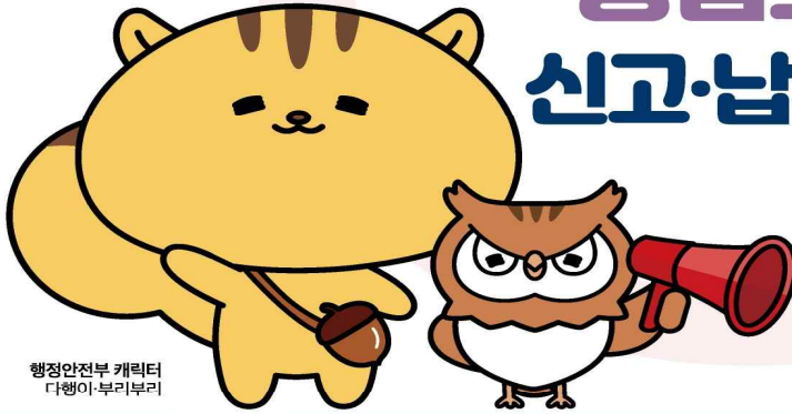
행정안전부 캐릭터 다행이·부리부리