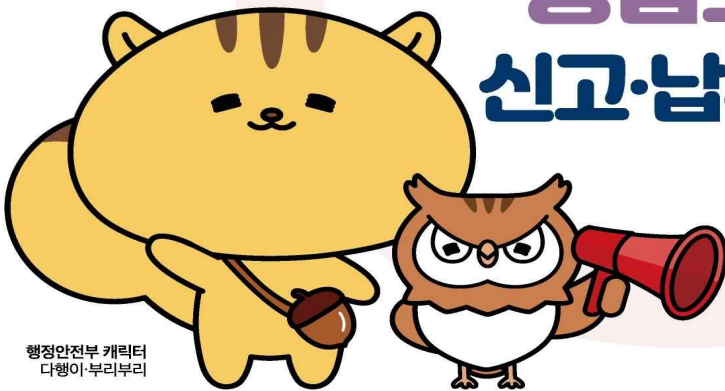
행정안전부 캐릭터 다행이·부리부리