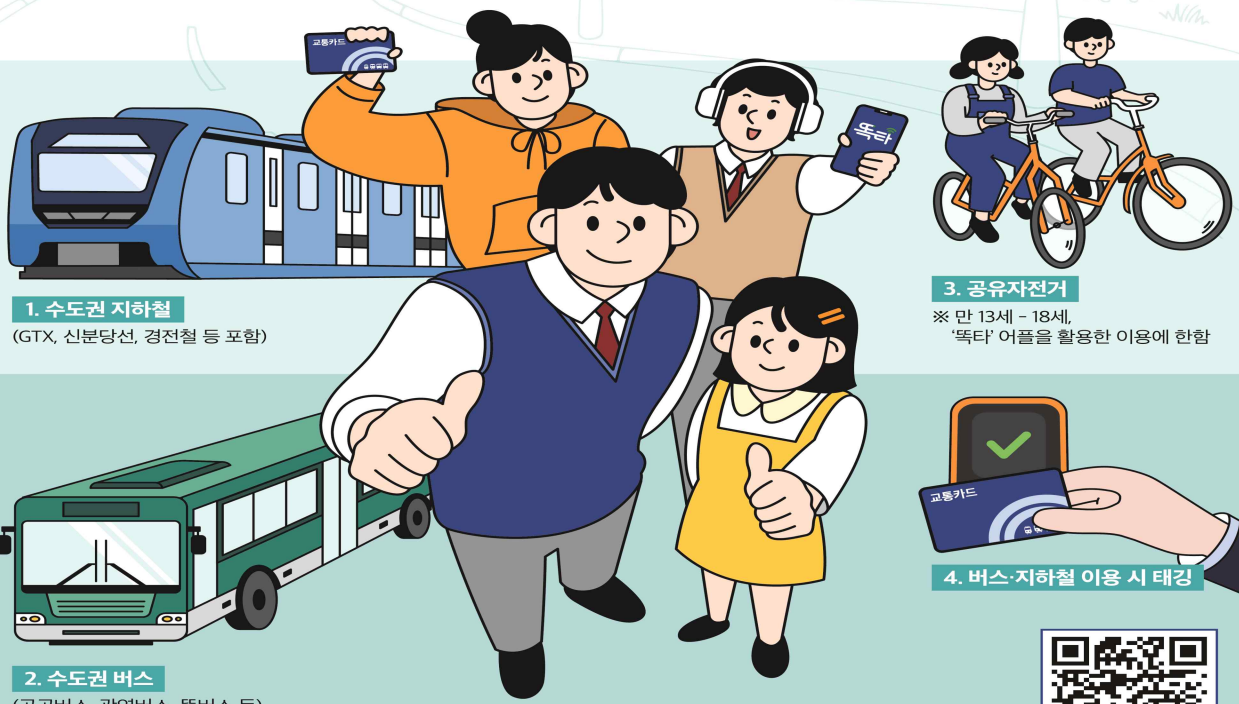
1. 수도권 지하철 (GTX, 신분당선, 경전철 등 포함)

※ 문의 : 1577-8459 (경기도 어린이·청소년교통비 지원사업 콜센터)