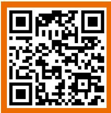
경기도평생교육이용권 누리집 QR코드