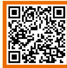
경기도평생교육이용권 사용기관 설명회 신청 QR코드