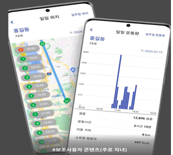
#보조사용자 콘텐츠(주부 자녀)

어딜 가셨는지, 몇 시에 가셨는지 아나고 안심돼요 부모님의 일/주간 걸음수, 보속/보폭 등을 알 수 있어요