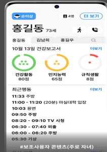
#보조사용자 콘텐츠(주부 자녀)

3가지 건강보고서를 일/주간으로 받을 수 있어요 부모님의 기상/복약 여부를 알 수 있어요