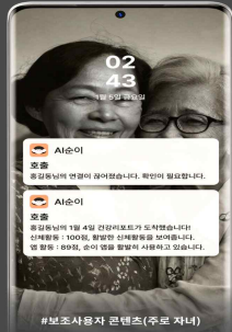
#보조사용자 콘텐츠(주부 자녀)